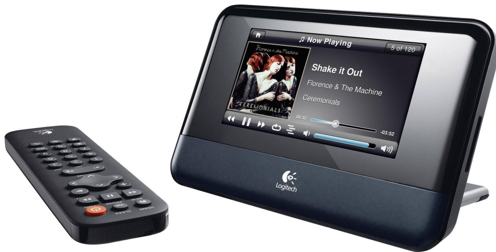
SqueezeBox Touch incl. AB